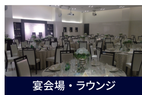
宴会場・ラウンジ