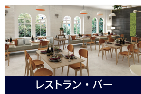
レストラン・バー