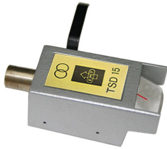
TSD15 SFL/LZ H