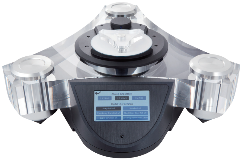
ブラックバージョン