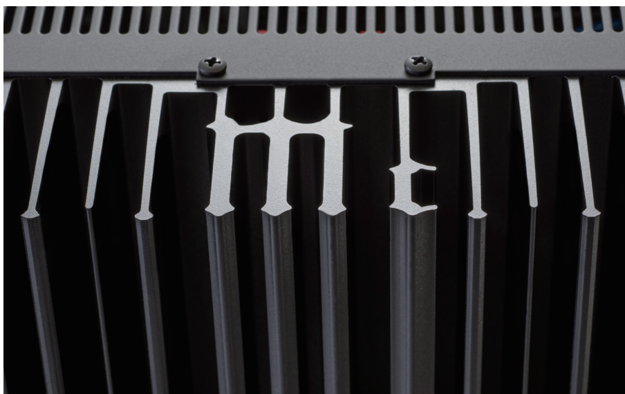
新デザインのマッキントッシュ・モノグラム・ヒートシンク (McIntosh Monogrammed Heatsinks™)