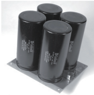
4個の新大型メインフィルターコンデンサー