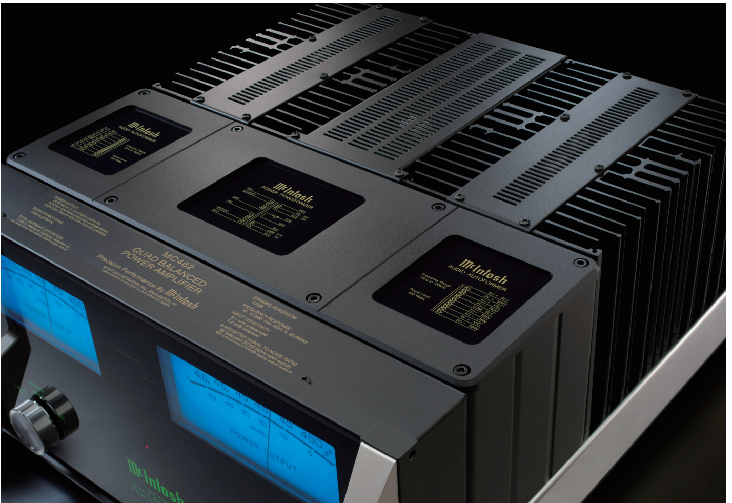
新デザインのトランスケース