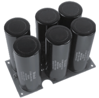
6個の新大型メインフィルターコンデンサー