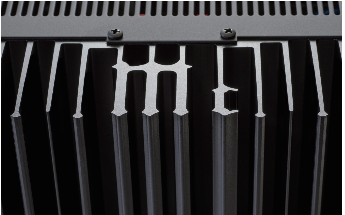
新デザインのマッキントッシュ・モノグラム・ヒートシンク (McIntosh Monogrammed Heatsinks™)