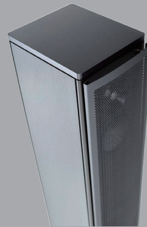
パンチングメタル・グリル (オプション)