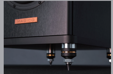
アップグレードスパイク APOD 8 (オプション)