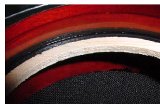
ミッドレンジボビンのパルサ材リング