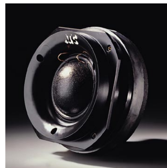
75mm φ ミッドレンジ