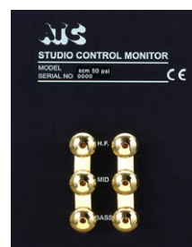
3-Way バインディングポスト