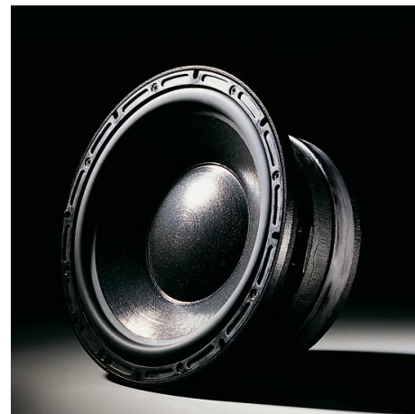
234mm φ SL ウーファー