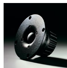
25mm φ トウイーター