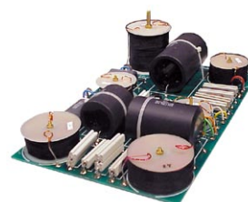
ハイパフォーマンスネットワーク