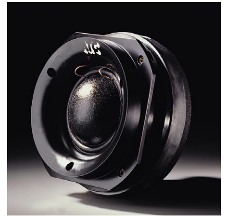
75mm φ ミッドレンジ