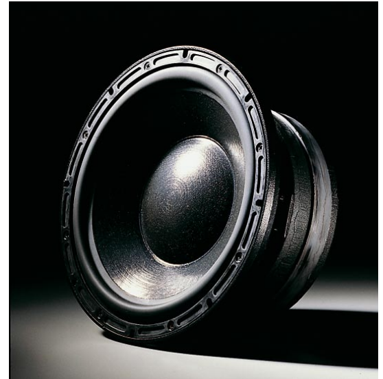
234mm φ SL ウーファー