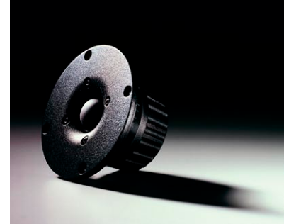
ハイパワーネオジウムトゥイーター