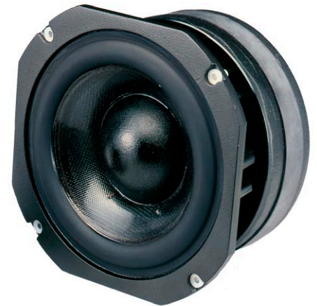
150mm φ SL ウーファー / 75mm φ インテグラルソフトドーム