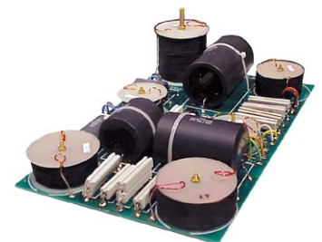
ハイパフォーマンスネットワーク