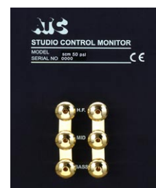
3-Way バインディングポスト