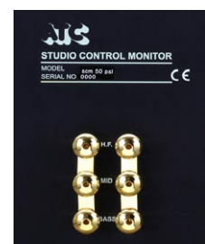
3-Way バインディングポスト