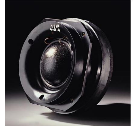
75mm φ ミッドレンジ