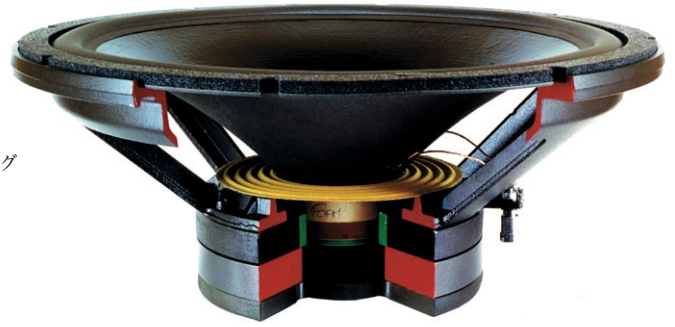
314mm φ SL ウーファー Cut Model