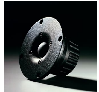
25mm φ トウイーター