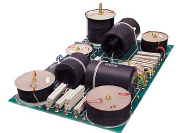
ハイパフォーマンスネットワーク