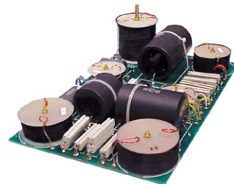
ハイパフォーマンスネットワーク