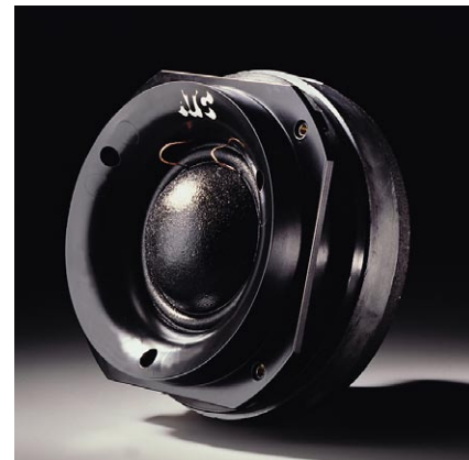
75mm φ ミッドレンジ