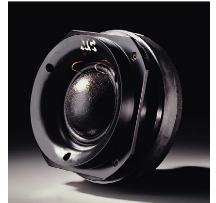
75mm φ ミッドレンジ