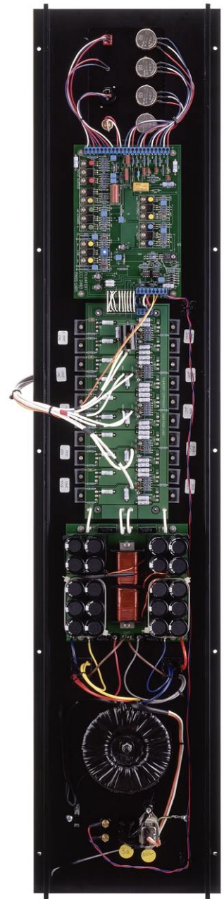
内蔵クロスオーバーネットワーク 20+20+20+80W マルチ ch. アンプ