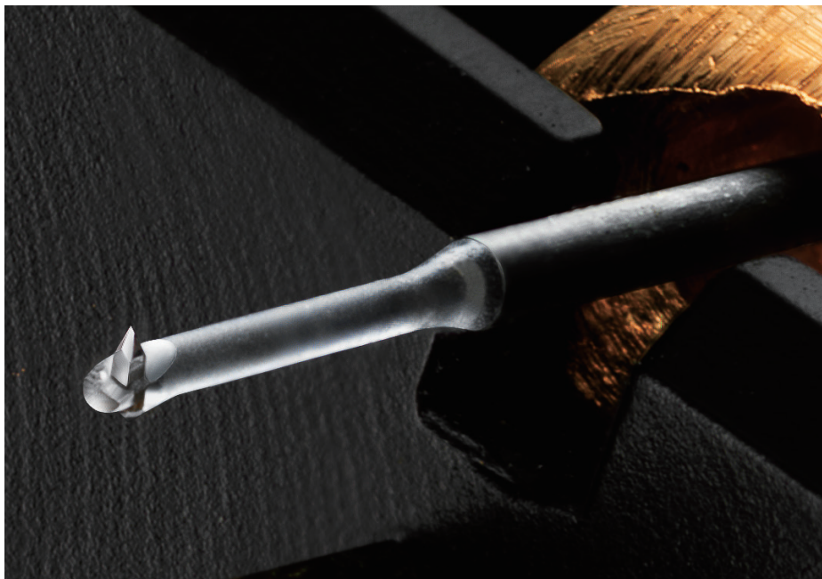
ホワイトサファイヤカンチレバー／アルミスリーブ

EMT カートリッジの歴史はアナログレコードの歴史でもあります、JSD Pure Black は録音意図に正確で優れた再生能力を発揮し、アナログレコードサウンドの更なるステップを実感していただけるでしょう。