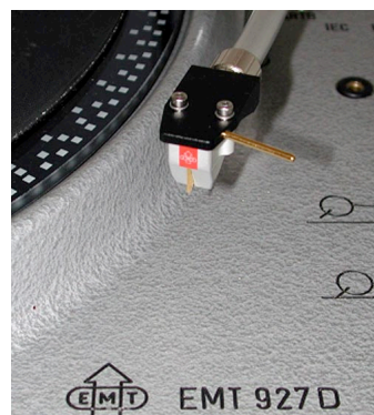
JSD5/6 + J-Headshell